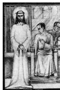
JEZUS WORDT TOT DEN KRUISDOOD VEROORDEELD LEIDEN A.C. 201