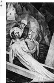
HET LICHAAM VAN JEZUS WORDT IN HET GRAF GELEGD LEIDEN A.C. 201