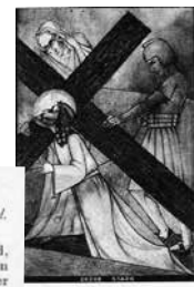
EERSTE VAL VAN JEZUS ONDER HET KRUIS LEIDEN A.C. 201