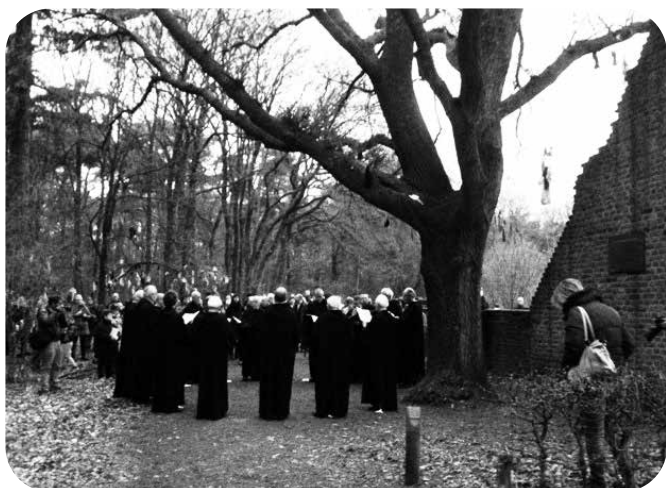
GREGORIAANSE ZANG BIJ DE KAPELRUÏNE EN KOORTSBOOM IN OVERASSELT OP PAASZATERDAG 4 APRIL 2026 OM 7.00 UUR

Met vogelgeketter en optrekkende ochtenddauw op de achtergrond zullen leden van de Schola Cantorum Karolus Magnus uit Nijmegen, gekleed als benedictijner monniken, op paaszaterdag 4 april 2026 om 7.00 uur bij het ochtendgloren voor de zeventiende keer een ochtendritueel zingen met oude gregoriaanse gezangen bij de koortsboom en de Sint-Walrickkapel, Sint-Walrickweg 5 te Overasselt.